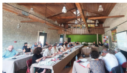
Comité de pilotage de l'OGS du 5 juillet 2022 à Cessero

Depuis le lancement de l'OGS par l'État en mai 2015, le projet et le territoire bénéficient d'une reconnaissance nationale (sur la liste et la carte des Grands Sites de France qu'ils soient en projet ou déjà labellisés).