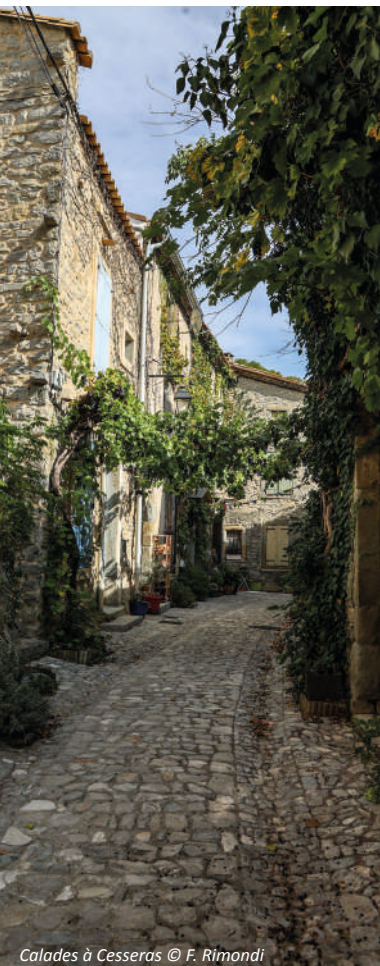
Calades à Cessero