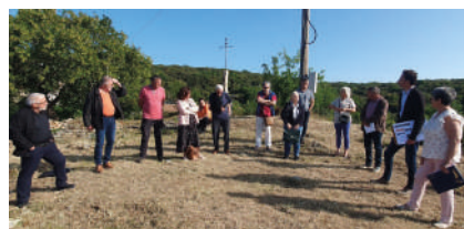
Comité des élus du 30 mai 2023 à Vélieux