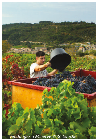
Vendanges à Minerve