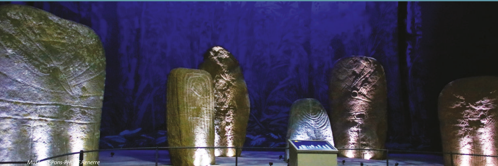
Musée Saint-Pons-PHLL - F. Rennerre

Avec vingt-sept musées de territoire dont trois musées de France, le Pays d'art et d'histoire Haut Languedoc et Vignobles abrite une offre muséale particulièrement riche. Témoignage d'un profond attachement des habitants pour la collecte et la transmission, cet ensemble muséal valorise le patrimoine local sous toutes ses formes : archéologie, arts et traditions populaires, sciences et techniques, nature ou beaux-arts.