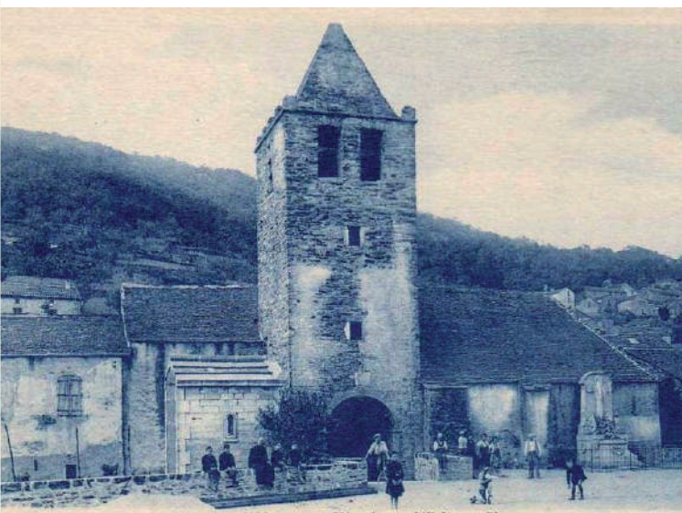
St-Vincent-d'Olargues (Hérault) — L'Eglise et Place