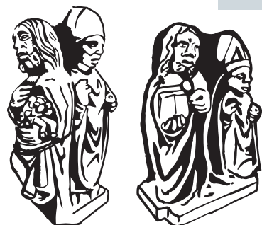
Détails des personnages latéraux

Several explanatory panels affixed in the church offer an interpretation of the work based on the analysis made by A. Favard, Member of the Société archéologique des Hauts-Cantons.