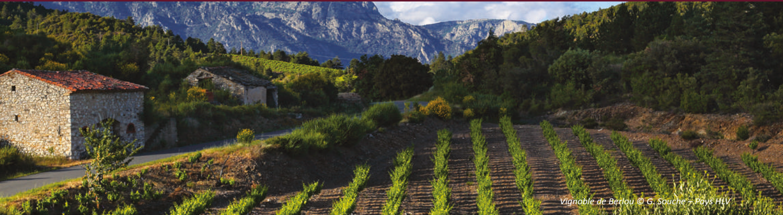
Vignoble de Berlau

L'œnotourisme est « centré principalement sur la rencontre d'exploitants viticoles (caves, châteaux, domaines) avec des touristes ou des excursionnistes venus déguster, acheter et comprendre le vin » (définition « Tourisme et Vin », Atout France, 2010). Il est une plus-value pour les producteurs et les professionnels du tourisme.